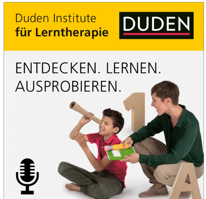
Abb. 5: „Entdecken. Lernen. Ausprobieren.“ heißt der Lerntherapie-Podcast der Duden Institute für Lerntherapie. Sie finden ihn überall dort, wo es Podcasts gibt.

Wir wünschen viel Spaß und Freude beim Spielen an der frischen Luft – ob im Urlaub oder zu Hause.