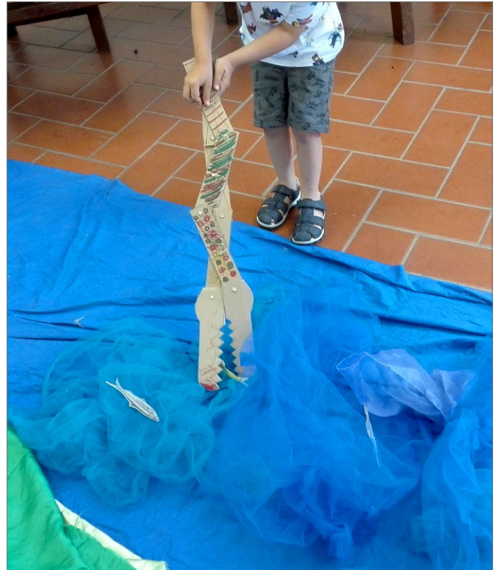
Abb. 1: Ein Junge spielt mit dem selbst gebastelten mechanischen Krokodil.

Für mich dreht sich Mathematik um Beziehungen, Nützlichkeit, Freude, Schönheit, Logik und Kommunikation. Es ist faszinierend, wie schon die Kleinsten im Kindergarten räumliche Beziehungen, Reihenfolgen und Mengen erforschen: Sie erkunden Höhen beim Klet-