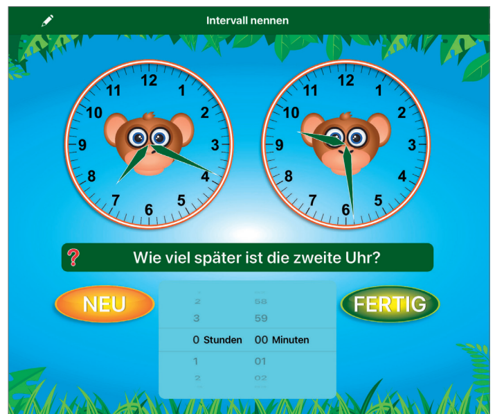
Abb. 1: Anstelle von Lernuhren motiviert diese Variante viele Kinder.

Eine App hat z. B. das Ziel, Kinder dabei zu unterstützen, ein Verständnis für Tageszeiten zu entwickeln. Dafür sollen in einer Übung drei Bildkarten mit Darstellungen zu typischen Aktivitäten (Schlafen,