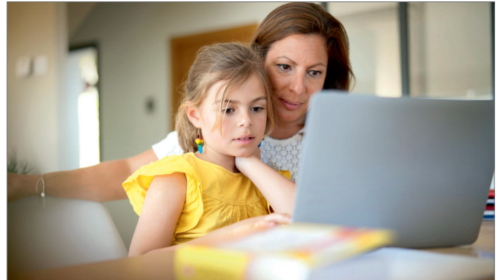
Mutter und Tochter im Homeschooling

Im Laufe der Zeit hat sich dann herausgestellt, dass es dem Kind leichter fiel pro Tag nur an einem Fach zu arbeiten. Jetzt ist der Rhythmus so vereinbart, dass ein Tag für Mathematik, ein Tag für Deutsch, ein Tag für Englisch geplant wird. Die Lernzeiten betragen auch jetzt immer 45 Minuten. Dazwischen liegen jeweils Pausen von 10–20 Minuten. Nach einer Stunde Mittagspause gibt es noch einmal 45 Minuten Lernzeit am Nachmittag. Diese Stunde wird jetzt so gestaltet, dass gemeinsam gearbeitet wird: Ein Elternteil lässt sich