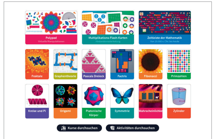
Kategorien in der App Mathigon